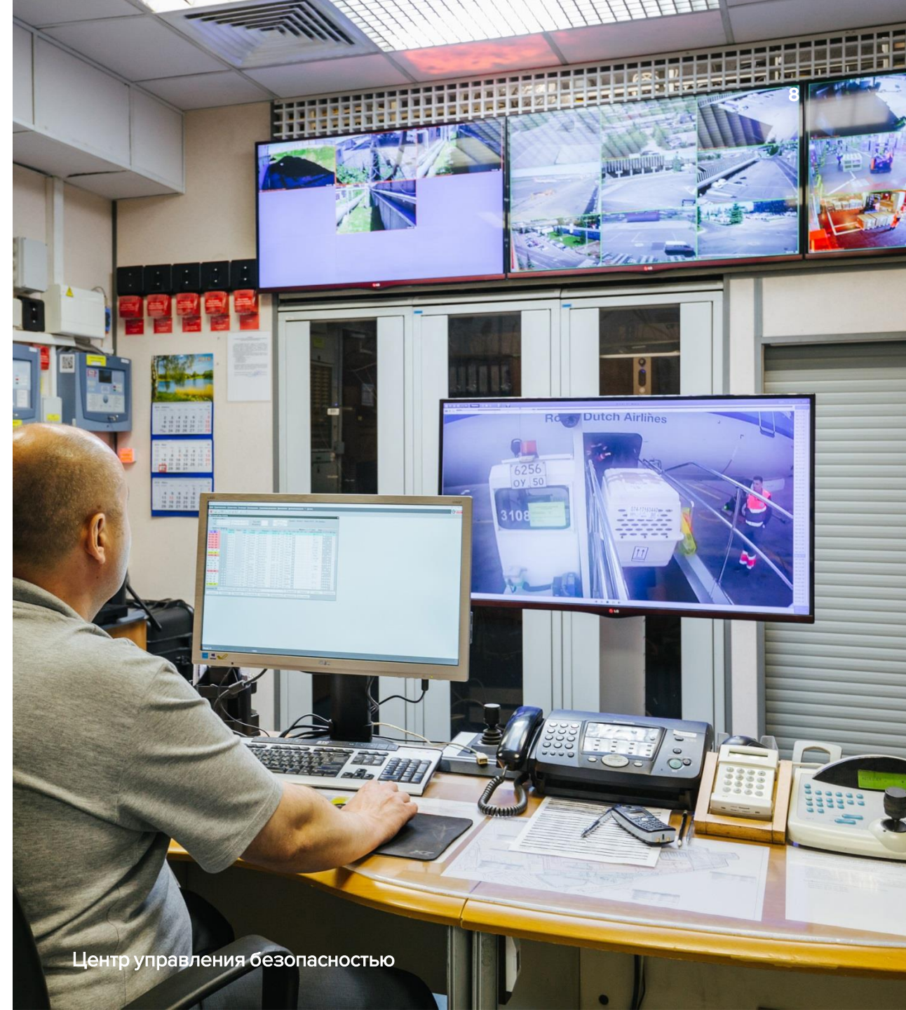
Центр управления безопасностью