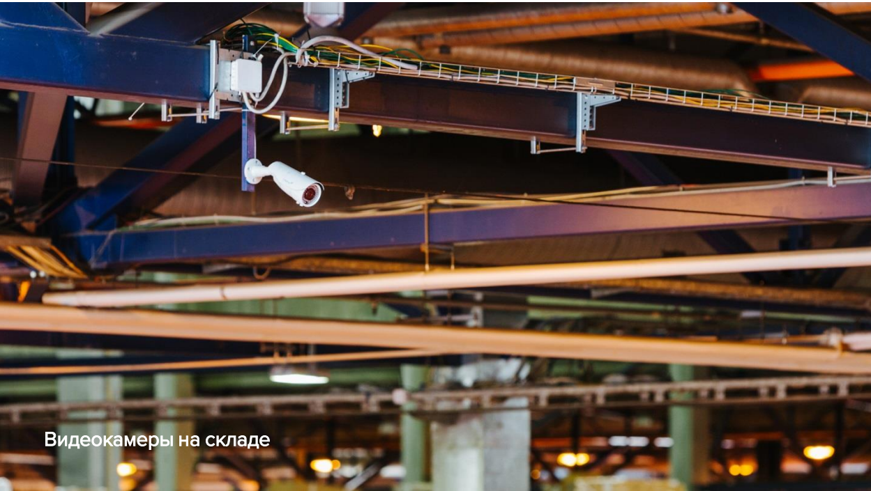
Видеокамеры на складе