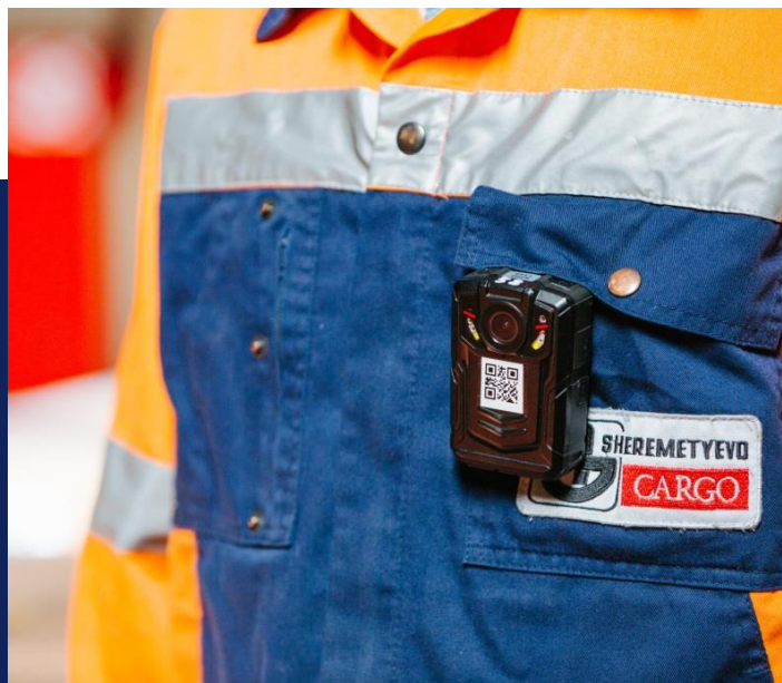
操作员视频记录仪

公司的数字视频监视系统配有600多个摄像头。贵重物品仓库的视频记录至少保存 30 天。