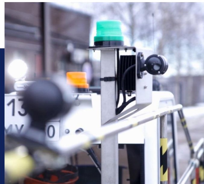
设备上的视频记录仪